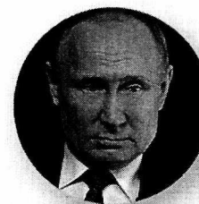
В.В. Путин Президент РФ

“ ...У нас в атомной промышленности мы реально работаем очень хорошо. Мы реально обогнали всех, мы больше всех делаем в мире атомных блоков для электростанций, это никакое не оружие, это высокие технологии...”